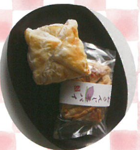
おさんじパイ 福井製菓店