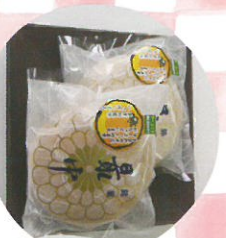
マーコット最中 白石製菓舗