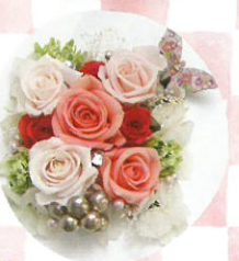
春の新作 プリザーブド フラワー 花よし