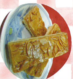
フロラソルト パルターージュ