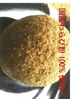
国産わらび粉 100% 使用！ 本わらび 200円 / 岩元製菓舗