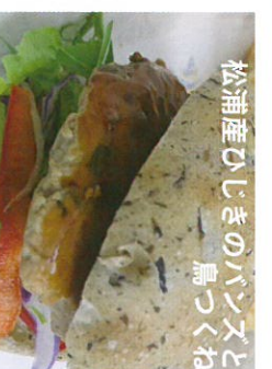
松浦産ひじきのパンズと 鳥つくね 松浦ひじきバーガー 220円 / Partage