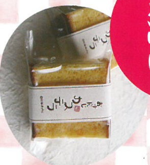
おさんじカステラ 岩元製菓舗