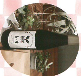
カフェオレの素 Matsuo Nouent+ Coffee