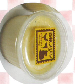
百枝プリン 百枝製菓舗