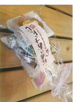
お得！焼き菓子セット 500円 / 菓子工房ひでみ