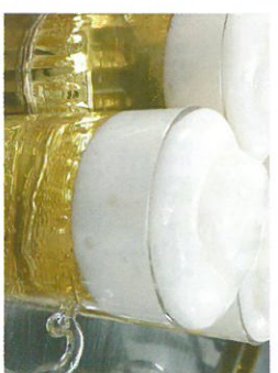
ビールゼリー-220円/百枝製菓舗 ※ノンアルコールビールを使用