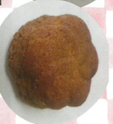
花カステラ 白石製菓舗