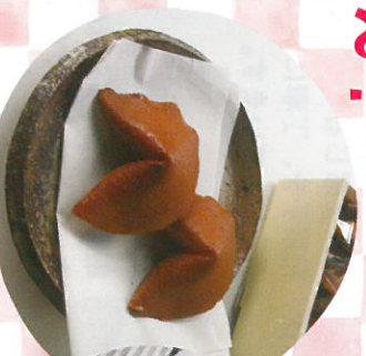
千代香 佐々屋菓子舗