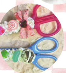
デコハサミ ハンドメイド雑貨ここ和