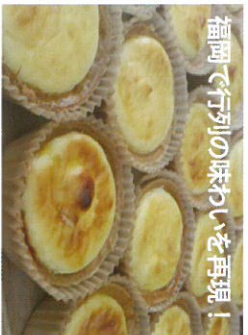
福岡で行列の味わいを再現！ チーズタルト 220円 / 福井製菓店