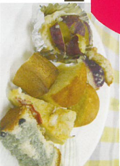
長崎短期大学 コラボ商品の販売